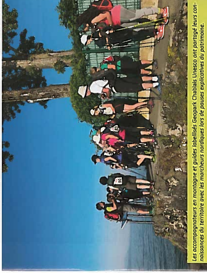
Les accompagnateurs en montagne et guides labellisés Geopark Chablais Unesco ont partagé leurs connaissances du territoire avec les marcheurs nordiques lors de pauses explicatives du patrimoine.

C'est en car que nous rejoignons tous ensemble l'Ecole des Missions du village franco-suisse de Saint-Gingolph. Dans ce centre des frères spiritains, nous profitons d'un magnifique coucher de soleil et de matelas confortables : belles conclusions de cette première journée de marche.